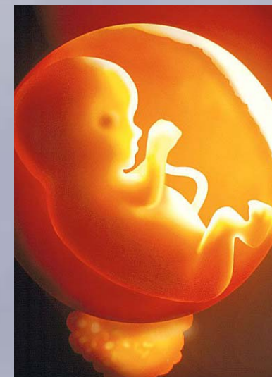
10 weken na de bevruchting - ware grootte